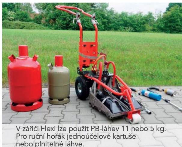
V zářiči Flexi lze použít PB-láhev 11 nebo 5 kg. Pro ruční hořák jednorúčelové kartuše nebo plnitelné láhve.