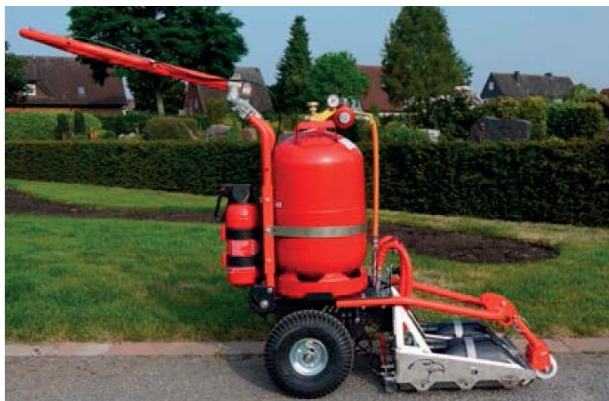
Optimální rozložení hmotnosti pro komfortní práci se zářičem Flexi.