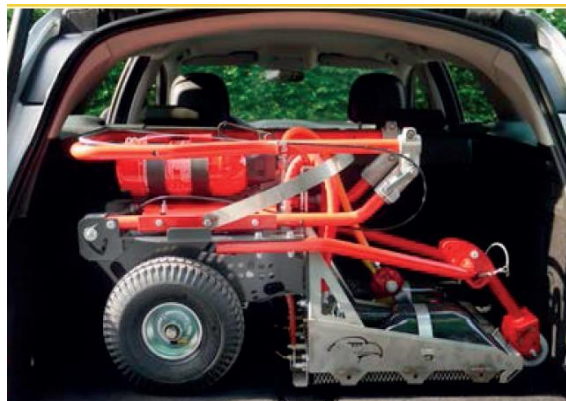
Díky možnosti rychlého složení a kompaktním rozměrům lze Flexi naložit téměř do každého kufru