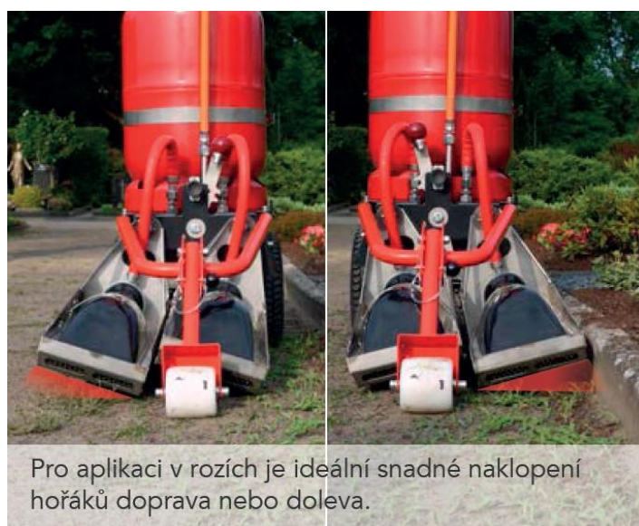
Pro aplikaci v rozích je ideální snadné naklopení hořáků doprava nebo doleva.

vyobrazení mají pouze informativní charakter a mohou se v některých detailech lišit