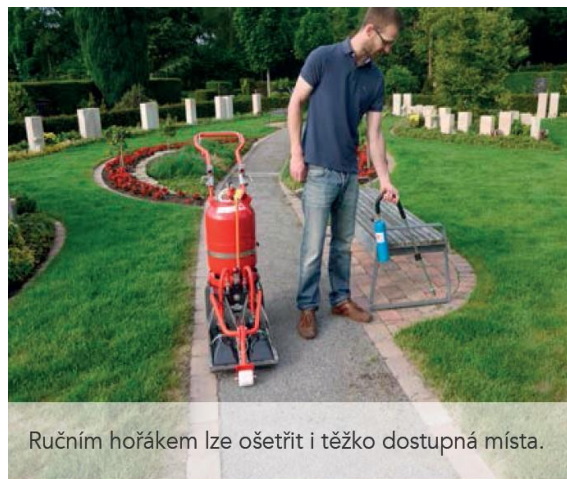
Ručním hořákem lze ošetřit i těžko dostupná místa.