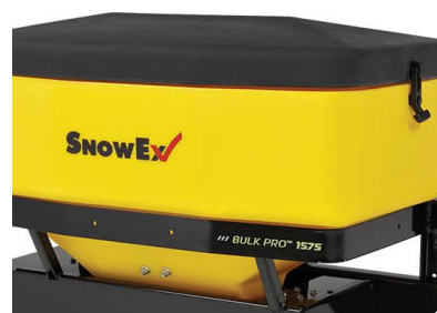
Horní kryt zásobníku

Poznámka: obrázky a fotografie mají pouze informativní charakter a mohou se od skutečného produktu v některých detailech lišit.