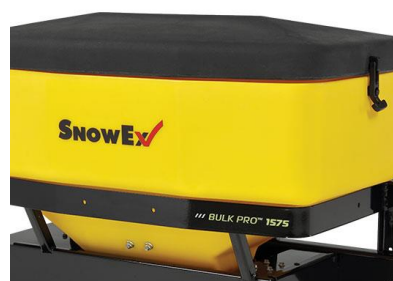
Horní kryt zásobníku

Poznámka: obrázky a fotografie mají pouze informativní charakter a mohou se od skutečného produktu v některých detailech lišit.